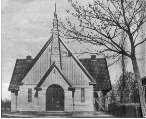
Het oorspronkelijke gebouw van 't Schienvat dat op 2 januari 1997 afbrandde